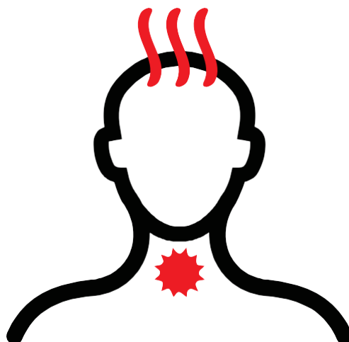
Dolor de garganta con fiebre