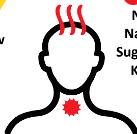
Pamamaga ng Lalamunan na May Lagnat