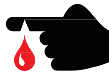
Nakalantad na Nahawaang Mga Sugat/Pigsa sa Mga Kamay o Braso