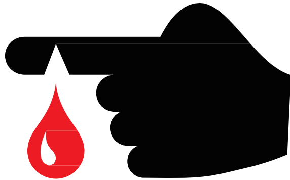
手或手臂上有暴露的感染伤口或疖子