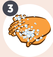
3 FROTE VIGOROSAMENTE por 15 segundos