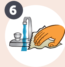
6 CIERRE LA LLAVE DEL AGUA con una toalla de papel