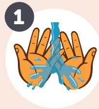
1 MOJE LAS MANOS con agua caliente